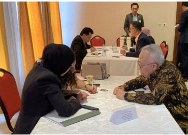
اجتماعات أعمال بين شركات أندونيسية وفلسطينية