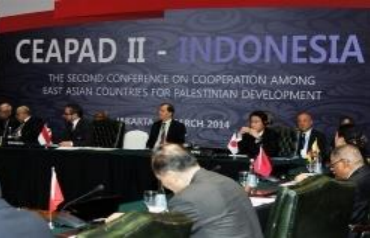
سيباد 2 (مارس 2014، جاكرتا)

(3) منذ عام 2019 فصاعداً، أقيمت فعاليات مطابقة الأعمال للشركات الفلسطينية بمشاركة شركات إندونيسية وفيتنامية وماليزية. ومؤخراً، شاركت سبع شركات فلسطينية في معرض غذائي في إندونيسيا في نوفمبر 2022، كما عرضت شركات فلسطينية منتجاتها في معرض فودكس باليابان 2023 في طوكيو في مارس 2023.