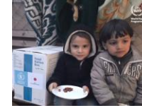
المساعداة الغذائية من خلال المساعداة الإنسانية الرسمية اليابانية (قطاع غزة)