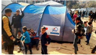
المساعداة العينية من خلال جايكا (خيام في غزة)