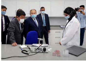
زيارة الوزير موتيجي لمنطقة أريحا الزراعية الصناعية