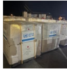
المساهمات العينية للأونروا بناءً على طلبها بموجب قانون التعاون الدولي للسلام